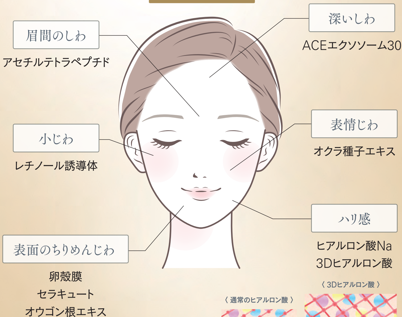
〈通常のヒアルロン酸〉